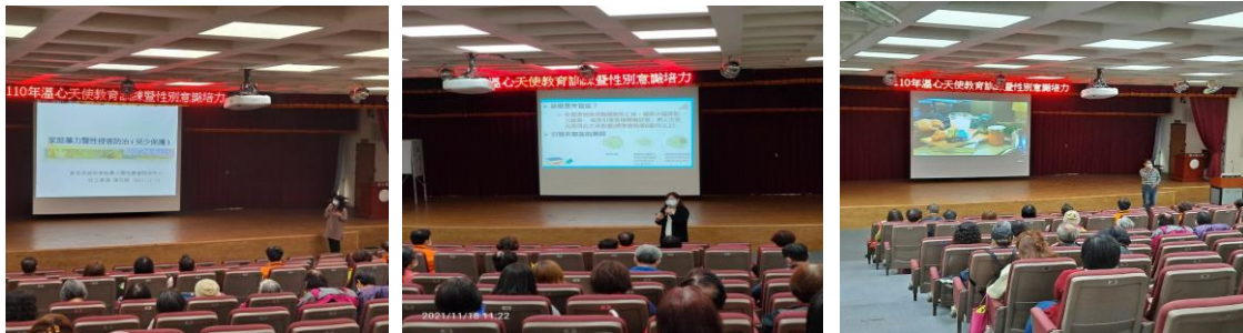
家庭暴力暨性侵害防治

實施內容：配合市府性別平等政策，邀請講師於溫心天使課程中翻轉性別刻板印象，透過互動式課程使參與民眾更能切身體會，除建立性別意識的觀念、增進性別意識敏感度亦能強化性別主流化概念，共辦理計3場次，參與總人數120人(男41人，女79人)。