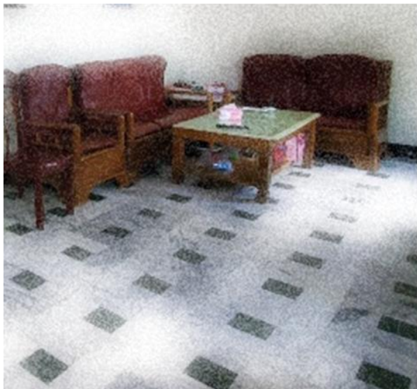
建 築 物 室 內