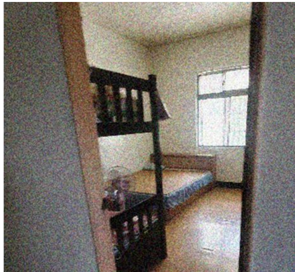
建 築 物 室 內